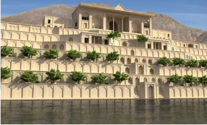
Şekil 2. Shiraz'da Bağ-ı Taht (Taht bağı), (Pouya, 2012)

Kral Süleyman döneminde bu dörtlü bahçelerin birinde inşa edilmiş olan, İsfahan'ın Heşt Beheşt'i (sekiz cennet) İranlılar arasında bahçe tasarımı sanatının ulaştığı ileri seviyeyi gösteren güzel bir örnektir. İsfahan'ın Çaharbağ Caddesi yine Safevi döneminde yapılmış olup Çaharbağ'a ait ünlü bahçeler şunlardır: Bağ-ı Taht (Taht bağı), Bağ-ı Kac (çam bağı), Baba Emir, Tophane, Nestern (yaban gülü), Bülbül, Fethabad, Güldeste, Kavushane ve Pehlivan. Safevi dönemindeki diğer bahçeler ise; Netenz Tacabad Bahçesi, Safevi Bahçesi ve Behşehr Sakin Bahçesi (Bağ-ı Halvet-i Behşehr), Gazvin Saadetabad ve Safevi krallarına ait sarayların diğer bahçeleri örnek olarak verilebilir (Şekil 2) (Aryanpur 1986).