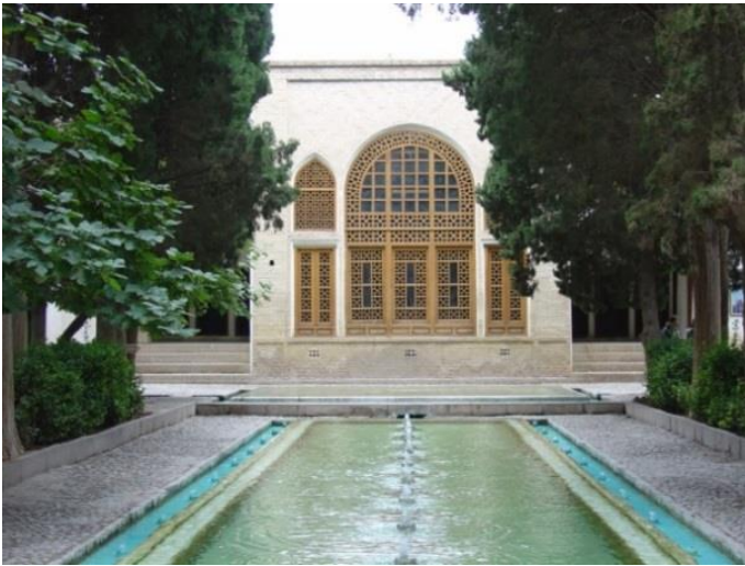
Şekil 1. "Fin-i kaşan" bahçesi (Herdeg, 1990)

sayıda bahçe inşa edilmiş olup birçokları günümüze dek hala ayakta kalmayı başarmıştır. İran bahçelerinin tasarımı ve yapısı genellikle İslam öncesi bahçe yapımı ve mimarlık tarzı ile İran mimarisinin genel özelliklerini taşımakta ve sonraki yüzyılların mimarlık tarzları olan İslami mimarlık ismiyle anılan üsluplardan ve başka ülkelerin mimarlık ve bahçe yapımı tarzlarından aldığı bazı etkilerin bir karışımı olarak bilinmektedir. Özellikle İslam'ın yaygınlaşmasıyla birlikte İran bahçelerinin mimarisi, cadde ve sokakların inşası, ağaç ve çiçek dikme tarzları, İran'a göç eden Araplardan pek etkilenmemiştir. Oysa İslamiyetin batıda kendini gösterdiği yerlerden biri olan İspanya ile Hindistan yarımadasında İslamiyet'in yaygınlaşıp genişlemesine karşın İran bahçe sanatı uzak ülkelere kadar yayılabilmektedir. İslami dönemde bahçeler, parklar ve ağaçlık alanlar oluşturma düşüncesi İranlıların daima ilgisini çekmiştir. Bunun yanı sıra şehirlerin dışındaki büyük, görkemli bahçelerle birlikte bu olgunun kent içi ve yakın çevresinde oluşturulması yüzyıllar boyunca devam etmiştir. İran'ın yerleşik eski şehir sakinleri doğa ve çevre konularında yeteri kadar bilgi sahibi olup güzel çevreler ve bahçeler oluşturma konularında son derece duyarlı tavır sergilemişlerdir. İlhanlılar ve Büveyhi dönemlerinden kalan "Fin-i Kaşan" bahçesi ile 5.Hicri yüzyıldan kalan "Taht-ı Şiraz" bahçesi kalıcı örneklerdir (Şekil 1) (Kiyani 2000).