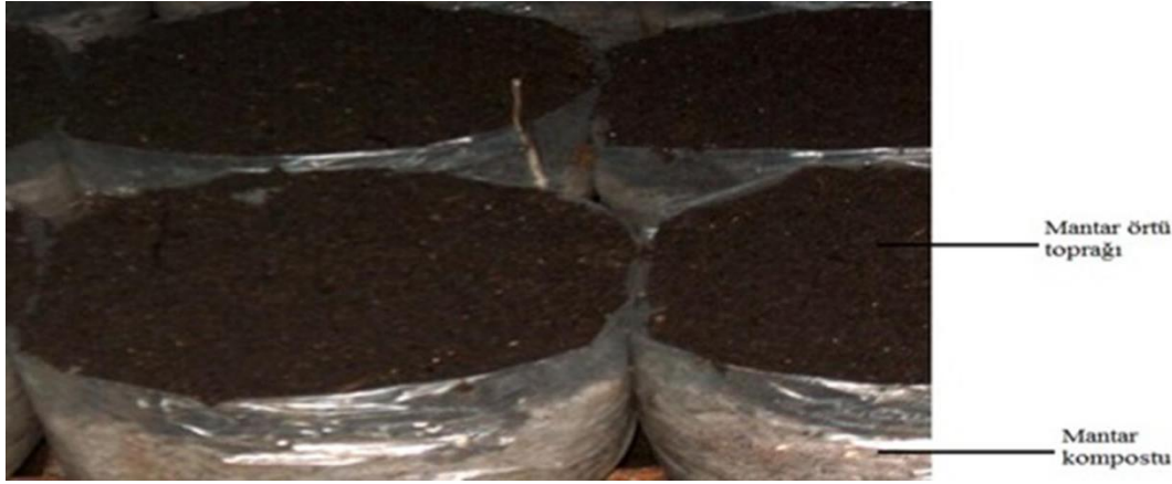
Şekil 1. Kültür mantarı kompostu (Özdemir, 2010).

Bu çalışmada, oduna alternatif bir hammadde olarak kültür mantarı üretiminde oluşan kompost atıkları yongalevhanın orta tabakasına farklı oranlarda ilave edilerek üretimler gerçekleştirilmiştir. Çalışmanın amacı; orta tabakası kompost ilaveli üretilmiş yonga levhaların farklı yönlerdeki vida tutma gücü ve ısı iletkenlik değerlerinde meydana gelen değişimlerin belirlenmesidir. Aynı zamanda yongalevha üretiminde kullanılan odun sarfiyatının azaltılarak, hem levha üretim maliyetlerin azaltılmasını sağlamak hem de yeni bir hammadde kaynağı olarak kompost atığını değerlendirmektir.