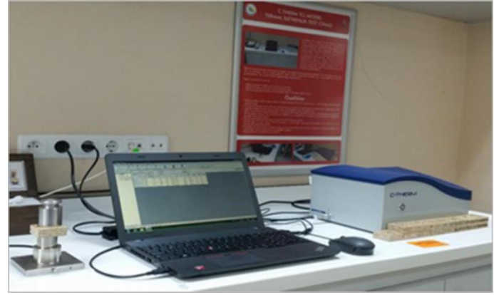
Şekil 3. Isı iletkenlik ölçüm cihazı.

Burada, k ısı iletkenlik değerini, q örnek kesit alanından geçen ısı akısını, t 2 /t 1 ölçülen zaman aralığı, T 2 -T 1 ölçüm cihazının iki yüzeyi arasındaki sıcaklık farkını ifade etmektedir.