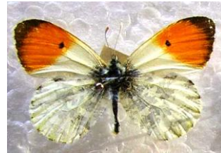
Şekil 9. Turuncu süslü kelebek ( Anthocharis cardamines )

Erkek birey dinlenmeden veya nektar kaynağına konmadan durmaksızın uçarken dişi, genellikle yumurta bırakabileceği bir bitki arayışındadır. Dişi kelebek yumurta bırakmak için bir bitki bulduğunda başlangıçta bitkiyi ayakları ile tadar. Bitki uygun ise, yumurtaların her biri tek tek bir çiçek sapına serilir. Yumurtaların tek tek serilmesinin sebebi, larvaların kannibalistik özellik taşımasından kaynaklanmaktadır (Tolman ve Lewington 1997). Orman içi açıklıklarda, meyve ağaçlarının bulunduğu bölgelerde, nemli çayır ve otlaklarda, nehir kenarlarında, derin vadi ve yol boylarında uçarlar. Tırtıllar sarımsak otu ( Alliaria petiolata L.), Arabis glabra L., Arabis hirsuta L., çobançantası ( Capsella bursa-pastoris (L.) Medik.) vs. bitkilerin yaprakları ile beslenir ve yılda bir döl verir. Ergin bireyler ise nektar kaynağı olarak böğürtlen ( Rubus fruticosus L.), dağ mayasılotu ( Ajuga reptans L.), Cardamines pratensis L., circamuk ( Stellaria holostea L.) gibi bitki türlerini tercih ederler (Koçak 1990; Hesselbarth ve ark. 1995).