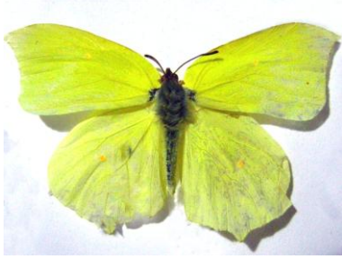
Şekil 2. Orakkanat ( Gonepteryx rhamni )

olurlar. Doğal şartların uygun olması halinde 1 yıla kadar yaşayabilirler. Erginler kış uykusuna yatar. Erkekler dişilerden daha önce kış uykusundan uyanır. Yumurtadan yetişkin hale gelme evreleri çok hızlıdır. Yumurtalar 10 gün sonra açılır ve tırtıllar çıkar. Bu nedenle kış uykusuna yatmadan önce yeterince beslenebilir (Tolman ve Lewington 1997; Koçak ve Kemal 2008).