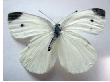
Şekil 5. Lahana kelebeği ( Pieris rapae )

Morfolojisi ve bazı biyolojik özellikleri: Kanatlarda ve damarlarda hâkim renk beyazdır. Dişilerde ön kanadın üst ve alt yüzünde M 2 -M 3 ve Cu 1 -Cu 2 arasında olmak üzere iki siyah benek bulunmaktadır. Erkek bireylerde ise Cu 1 -Cu 2 arasında bu benekler kanadın üst yüzünde bulunmaz. Ön kanat apeksinin üst yüzeyi siyah lekeli olup her iki eşeyde de arka kanatların kostal kenarında küçük siyah bir benek vardır. Kanatların alt yüzünde ön kanatların apeks bölgesi ile arka kanatlar açık sarı renkteyken arka kanatlarda yeşil lekeler fark edilir. Ön kanatların kostal kenarında kaideye doğru siyah bir şerit uzanır. Antenleri siyah renkli ve topuz biçimindedir (Şekil 5). Dişi ve erkek erginlerde toraks gri renkte kıllarla kaplıdır. Tırtıllar sarımsak otu ( Allaria petiolata L. ), Kafkas kazteresi ( Arabis caucasica Willd. ), küçük nicer otu ( B. stricta Andrz. ), nicer otu ( B. vulgaris, R.Br. ), ak deliotu ( Berteroa incana L. ), uzun hardal ( Brassica elongata Ehrh. ) bitki türlerini tercih eder. Polifag olup 20'den fazla bitki ile beslenmektedirler (Koçak 1986, 1990 ve 1992; Hesselbarth ve ark. 1995).