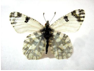
Şekil 7. Dağ öykölösü ( Euchloe ausonia )

Dünyadaki Yayılışı: Avrupa kıtası (Hesselbarth ve ark. 1995; Tolman ve Lewington 1997).