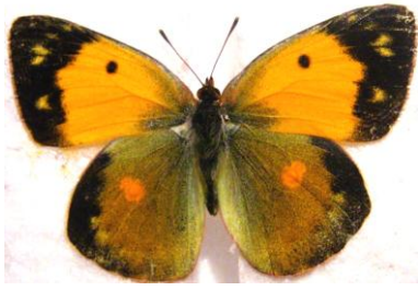
Şekil 3. Sarı azamet ( Colias crocea )

Dünyadaki Yayılışı: Güney Avrupa, Kuzey Afrika, Güney Hindistan, Orta Asya ve Sibirya, İngiltere'nin güney kıyıları (Asher ve ark. 2001).