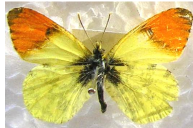
Şekil 10. Turuncu süslü doğu kelebeği ( Anthocharis damone )

içbükeydir. Her iki bireyin arka kanatlarının üst yüzeyi lekesiz, alt yüzeyi ise beyaz zemin üzerinde, soluk yeşil-gri noktalara sahiptir. Bu lekelenmeler arka kanadın üst yüzeyinden görülür. Her iki bireyde toraks gri kıllarla örtülüdür. Her iki bireyde kaideden başlayarak bazal bölgeye doğru uzanan belirgin siyah pulların varlığı dikkat çekmektedir. Antenlerinin uç kısımları topuz biçimindedir (Şekil 10). Larvaları çivit otu ( Isatis tinctoria L.) ile beslenirler. Dağlık yerlerdeki sıcak ve çiçekli vadiler veya akarsu bulunan yamaçlar, açık çam ormanları ve bozkırlarda, ağaçlık ve çalılık alanlarda, 1000-1500 m rakımlar arasında yaşar. Nisan başlarında görülmeye başlayan türün yoğunluğu, Mayıs ayının ortalarında artar. Erginler Temmuz ayının ortalarına kadar uçar ve yılda bir döl verir (Hesselbarth ve ark. 1995).