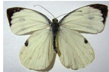
Şekil 4. Büyük lahana kelebeği ( Pieris brassicae )

Cu 1 -Cu 2 arasında iki siyah benek bulunur. Bu iki benek dişilerde kanadın hem alt hem de üst yüzünde bulunurken, erkeklerde üst yüzde bu benekler yoktur. Dişilerde ön kanat dorsumunda kısa siyah bir şerit uzanırken erkeklerde ön kanatta kaideden başlayarak kostal kenar boyunca apekse doğru ince bir şerit uzanmaktadır. Erkeklerde arka kanatların üst yüzeyinde damarlar üzerinde ve değişik alanlarda yeşil lekeler görülür. Ön kanatların alt yüzünde apikal bölge ile arka kanatların alt yüzü sarı-gri renktedir. Ayrıca arka ve ön kanatların alt yüzünde bazal bölge toz serpintisi şeklinde siyah lekelerle kaplıdır (Şekil 4). Erkek ve dişi ergin bireylerde toraksın üzeri koyu gri renkte uzun tüylerle kaplıdır. Antenleri siyahtır ve uçları topuz biçimindedir. Ergin P. brassicae L. kelekleri genelde hayıt ( Vitex agnus-castus L.), mine ( Lantana camara L.), dağ mayasılotu ( Ajuga reptans L.), karlına devedikeni ( Carlina vulgaris L.) ve kır çiçekleri üzerine konar.