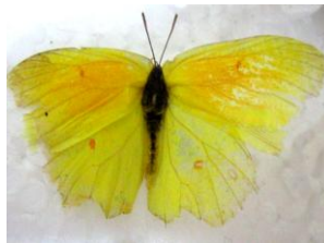
Şekil 1. Kleopatra ( Gonepteryx cleopatra )

Genellikle kayalık, açık ve çalılık yerlerde görülür. Güneşli-aydınlık alanlarda daha sık rastlanır. Konukçu bitki olarak cehri ( Rhamnus alaternus L. ) ve akdiken ( R. catharticus L. ) tercih eder. Yılda tek döl verir, doğada Mayıs ayı ortalarından başlayarak Ağustos ayının sonlarına kadar görülmektedir (Tolman ve Lewington 1997).