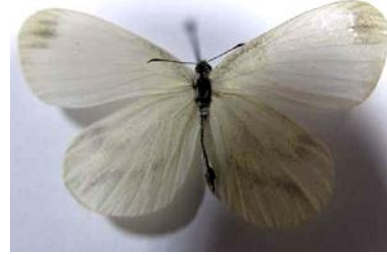
Şekil 11. Narin ormanbeyazı ( Leptidea sinapis )

bölgelerde görülebilirler. İki, bazen üç nesil oluştururlar (Hesselbarth ve ark. 1995; Baytaş 2008).