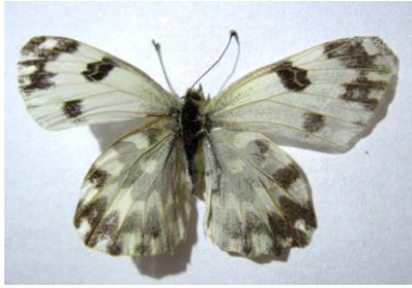
Şekil 6. Yeni benekli melek ( Pontia edusa )

Dişilerde arka kanatların üst yüzünde kostal ve termende kahverengi ya da siyah lekeler, ön kanadın üst yüzünde Cu_2 ve A_1 arasında siyah bir benek bulunur. Her iki eşeyde de arka kanatların alt yüzü tamamen yeşil-sarı lekelerle kaplı olsa da arka kanatlarda, R_5, M_1, M_2, M_3, Cu_1, Cu_2 ve A_1 arasında termen, kosta ve dorsuma kadar uzanan beyaz lekeler görülmektedir. Yine arka kanatların postdiskalinde Cu_2-M_1 arasında beyaz renkli zikzak bir alan görülür. Dişi ve erkeklerde toraks kahverengi-siyah, abdomen ise koyu gri kıllarla örtülüdür. Antenleri topuz biçimindedir (Şekil 6).