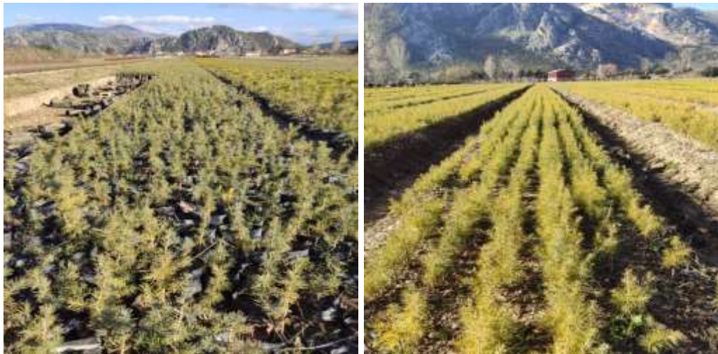
Şekil 1. Çalışmada örneklenen şaşırtılmış ve şaşırtılmamış fidanlar

Türün Eğirdir Orman Fidanlığında yetiştirilen ve uygulamadaki dikime uygun yaştan (Anonim 1986) rastgele örneklenen ve birinci vejetasyon dönemi sonunda şaşırtılmış 1+1 yaşlı tüplü ( ŞT ) ve 2+0 yaşlı çıplak köklü ( ÇK ) fidanlarında, 2020 yılı büyüme dönemi sonunda; 0.1 cm hassasiyetle fidan boyu ( FB ) ve 0.01 mm hassasiyetle kök boğazı çapı ( KBÇ ) ölçümü gerçekleştirilmiş (Şekil 2) ve bu çalışmada şaşırtılmış ve şaşırtılmamış fidanlar işlem olarak ifade edilmiştir.