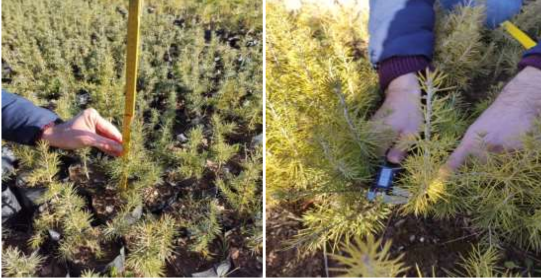
Şekil 2. Fidanlarda boy ve kök boğazı çapı ölçümü

Elde edilen fidan boyu ve kök boğazı çapı verileri SPSS paket programında değerlendirilerek; fidanların boy ve kök boğazı çapı bakımından Türk Standartları Enstitüsü'nün (TSE) kalite sınıflarına dağılımı belirlenmiştir (Anonim 1988, Çizelge 1). Şaşırtılmış ve şaşırtılmamış fidanlar ile kalite sınıfları varyans analizi (ANOVA) ile karşılaştırılarak; TSE kalite sınıflarının çalışmaya konu fidanlara uygunluğu Ayırma (Diskriminant) analizi ile denetlenmiştir. Bunlara ek olarak özellikler arasındaki ilişkiler korelasyon analizi ile tahmin edilmiştir.